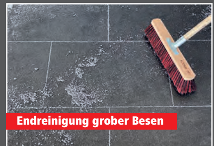
Endreinigung grober Besen