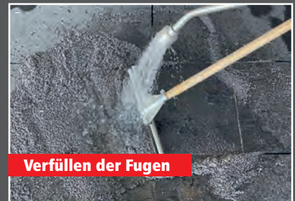
Verfüllen der Fugen